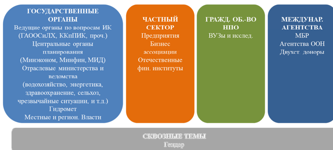
Иллюстрация 1 Основа для проведения институционального анализа в рамках разработки национальной стратегической программы СППАИК – предложенная представителями МБР и утвержденная представителями государственных органов Кыргызской Республики

Более того, представителями многосторонних банков развития и государственных органов Кыргызской Республики было согласовано, что до начала Второй совместной миссии специалистов МБР будут проведены специализированные консультации по межотраслевым темам – таким как, например, гендерные вопросы - с участием представителей МБР и Экспертной группы; целью таких предварительных консультаций будет выработка рекомендаций о том, как обеспечить широкомасштабную представленность темы гендера в составе мероприятий по повышению устойчивости к изменению климата в Кыргызской Республике. Результаты консультаций по институциональному анализу лягут в основу детализированной структуры Секретариата по климатическим финансам.