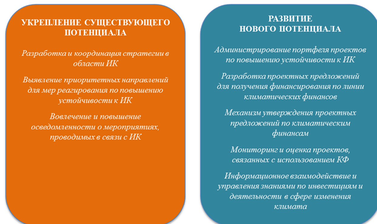
Иллюстрация 3 Потребности по развитию потенциала в части координирования климатических финансовых ресурсов – выявленные представителями МБР и государственных органов Кыргызской Республики

В целях подготовки основы для механизма по координации климатических финансовых ресурсов в Кыргызской Республике – механизма, с помощью которого будет осуществляться реализация национальной стратегической программы СППАИК, представители МБР и государственных органов Кыргызской Республики согласились с тем, что необходимо проведение детализированной оценки навыков и потенциала действующих институтов в Кыргызской Республике, включая министерства, ведомства и координационные советы, по выполнению вышеуказанных функций. Данный анализ будет проводиться Экспертной группой, при поддержке МБР и представителей государственных органов Кыргызской Республики.